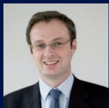
Deputy Managing Director